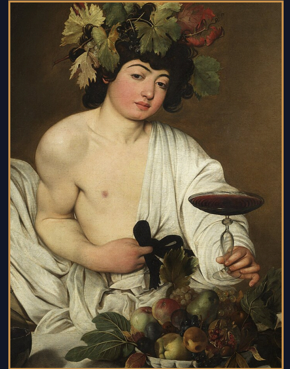
QUI SUIS-JE ?

NOMEN MIHI EST D... APUD GRAECOS ET V... APUD ROMANOS.