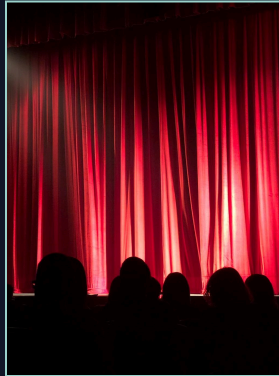
DIEU DU THÉÂTRE