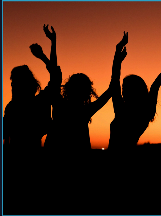
DIEU DE LA FÊTE