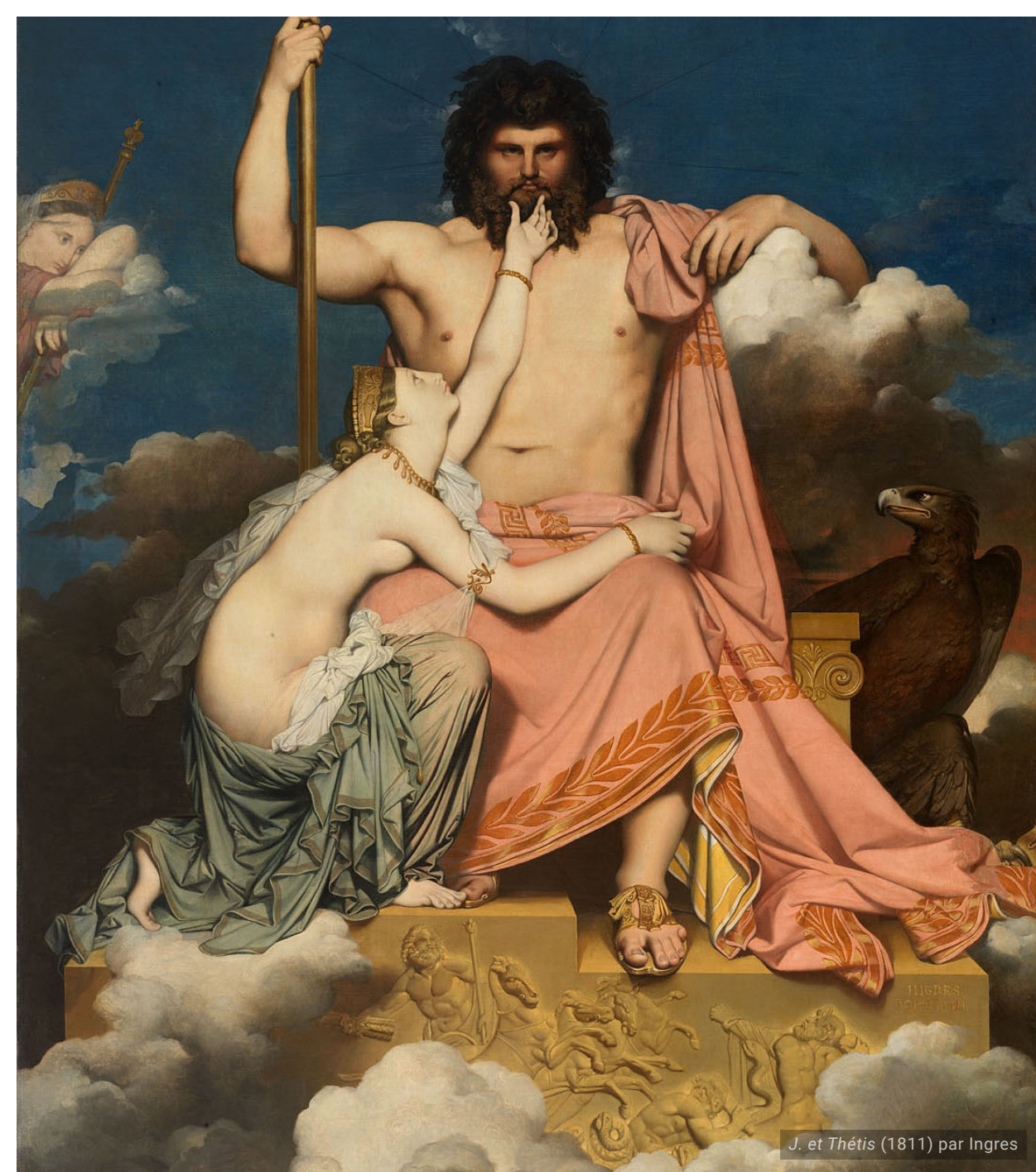
J. et Thétis (1811) par Ingres

NOMEN MIHI EST Z... APUD GRAECOS ET J... APUD ROMANOS.