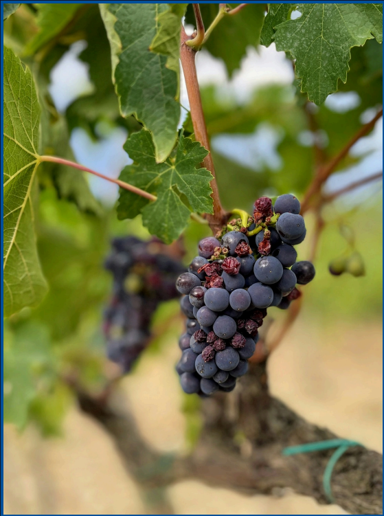
DIEU DU VIN ET DE L'IVRESSE