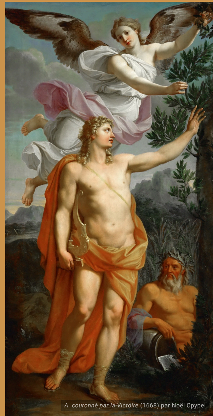
A. couronné par la Victoire (1668) par Noël Coypel

NOMEN MIHI EST A... APUD GRAECOS ET P... APUD ROMANOS.