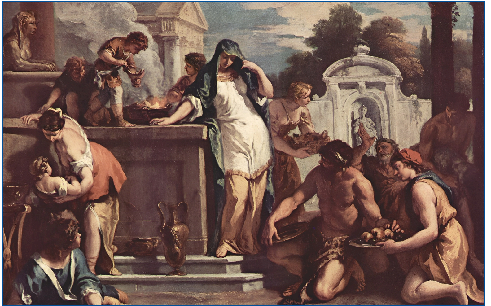
Offrande à la déesse V. (1723) par Sebastiano Ricci

Je suis la déesse de la maison et du foyer. Je suis la plus ancienne des déesses, née des Titans Cronos et Rhéa. Je suis aimée des mortels pour mon calme et ma bienveillance. Je suis présente dans toutes les familles, veillant sur le feu qui symbolise le confort et la prospérité domestique.