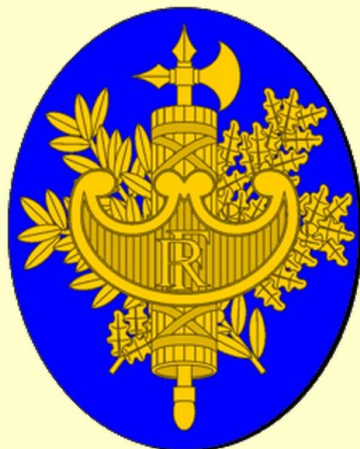
République Française Armes semi-officielles

Le faisceau est recouvert d'un bouclier sur lequel sont gravées les initiales R.F. (République française). Des branches de chêne et d'olivier entourent le motif. Le chêne symbolise la justice, l'olivier la paix.